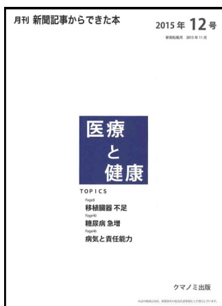
月刊新聞記事からできた本 医療と健康

https://elib.maruzen.co.jp/elib/html/SeriesDetail/Id/3000024183